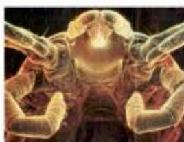
Электронная микрофотография вши

Используются педикулоцидные средства, убивающие вшей на всех стадиях развития: взрослые насекомые, нимфы, гниды. Эффективными препаратами для уничтожения головных вшей являются: Ниттифор, Нитилон, Лонцид, Медифокс, Медифокс-супер, Авицин, Перфолон. При необходимости обработку повторяют через 7-10 дней. Препараты продаются в аптеках без рецепта врача. Но оптимально, чтобы лечение назначил врач, с учетом индивидуальных особенностей пациента. Большинство из данных препаратов противопоказаны детям, беременным и кормящим женщинам. Нимфы и взрослые особи вшей легко уничтожаются вышеперечисленными химическими препаратами, а яйца вшей (гниды) защищены коконом, из-за чего большая их часть выживает и продолжает популяцию в дальнейшем, поэтому необходим механический способ удаления (вычесывание гребнем, стрижка волос).