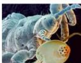
Электронная микрофотография: вошь и гнида (яйцо вши)