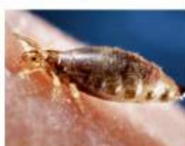
Увеличенное фото: вошь в процессе кровососания

При лечении педикулеза, одновременно с использованием специальных препаратов, проводят санитарную обработку и дезинсекцию белья, верхней одежды, постельных принадлежностей (стирка вещей в стиральной машине, утюжка, особенно области швов).